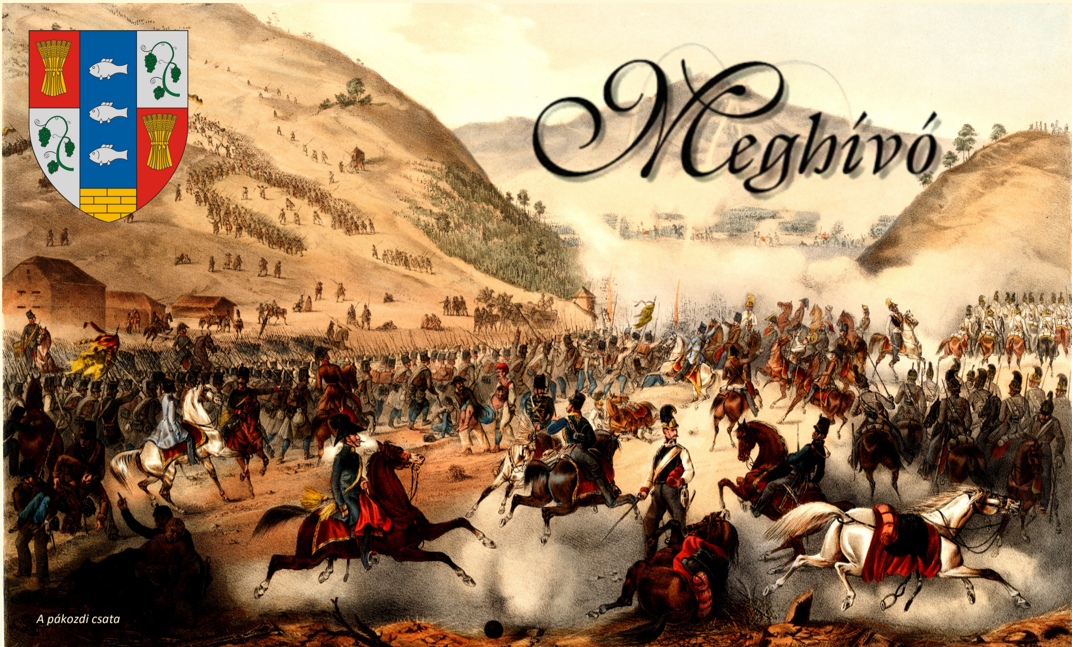
A pákozdai csata

Pátka Község Önkormányzata meghívja Önt és kedves családját az 1848. szeptember 29-ei Pákozd-Sukoró-Pátkai csata 172. évfordulóján tartott megemlékezésre